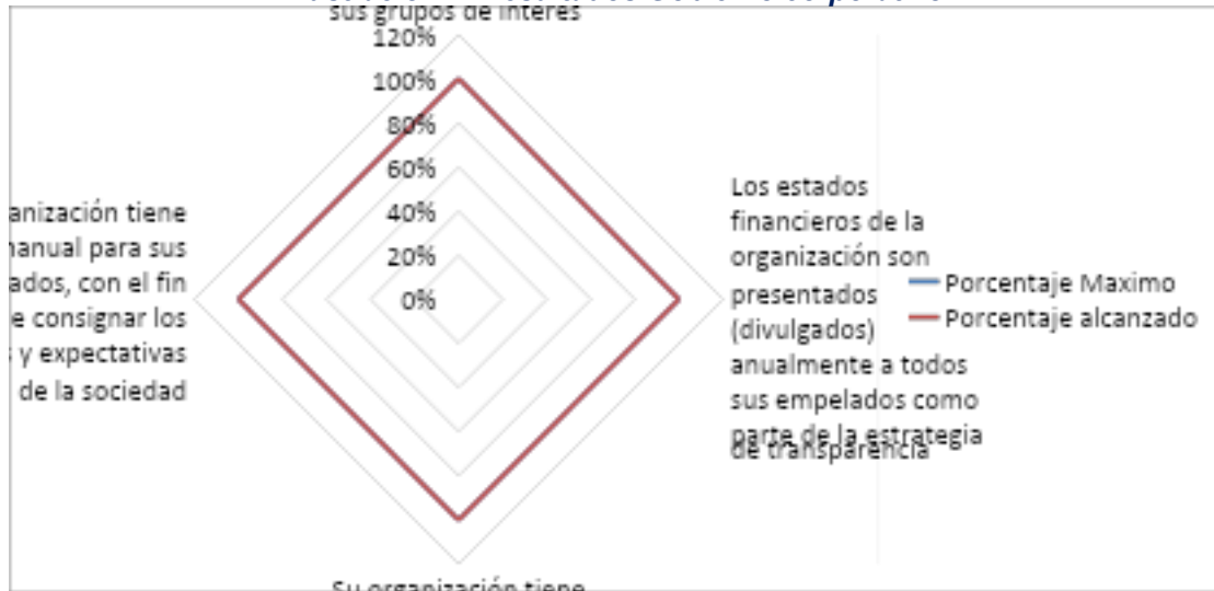
Ilustración 2: Resultados Gobierno corporativo